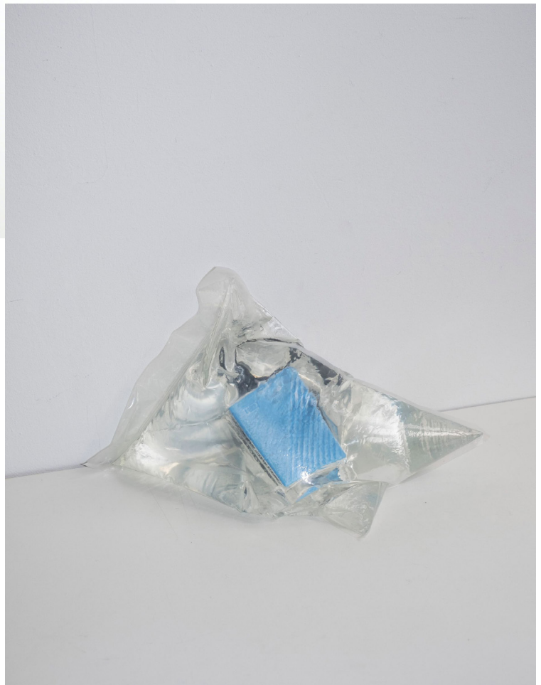
Abbildung: o.: © Gretta Louw, „Entanglement“, acrylic pen on polypropylene paper, 22 x 32 cm, 2020 u.: © Simone Kessler, „Images of Bombs Stored in the Sea, Stored on a Hard Drive, Stored in a Vacuum-sealed Plastic Bag, Stored in Sea Water, Stored in a Plastic Bag“, Signed by the Artist, Object, Earthly Matters, 2021