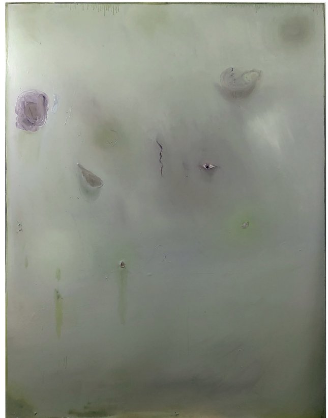
Andreas Lech, grau ©Andreas Lech