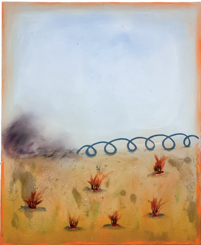
Julian Arayapong, sie kommen näher ©Julian Arayapong

vermag. Wir sind uns der tragenden Rolle der Malerei in der bildenden Kunst bewusst. Das Lernen, die Beherrschung, die Erfahrungen möchten wir gerne, ab und an einem größeren Teil zuteil werden lassen, den immerwährenden Diskurs, Neues, Anknüpfendes und schon Dage-wesenes beäugen lassen zu dürfen, Urteilen nicht aus dem Wege zu gehen sondern sich mit Aussagen, Kritiken, möglichem Lob auseinanderzusetzen, um sich daran zu laben und sich daran zu stören und sich daran weiter zu hangeln. Es gibt keinen Stillstand, selbst die leerste Leinwand ist schon ein gewichtiges Gewicht an Gewichtigkeiten, sodass, ja sodass die Stille zu hören ist, die einem schaffenden Wesen zugegen ist, so laut es um diese lärmern mag, ein ewiges Lernen ist unverkennbar, auch wenn es keine Ewigkeit gebe.